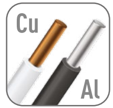
Возможна коммутация алюминиевым и медным проводником