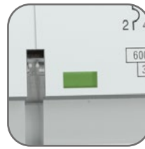
Окно реального состояния контактов с защитой от искр