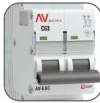
Литая лицевая панель