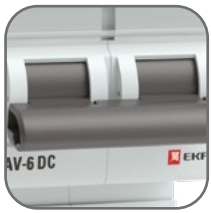
Механизм мгновенной коммутации (ММК)

Автоматические выключатели для постоянного тока AV-6 DC EKF AVERES предназначены для защиты электрических цепей постоянного тока от токов перегрузки и короткого замыкания, проведения тока в нормальном режиме и оперативных включений и отключений цепей постоянного тока. Полный набор аксессуаров для расширения функций. Гарантийные обязательства 10 лет.