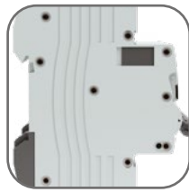
Жесткий корпус, 9 заклепок