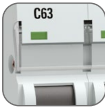
Удобное окно для маркировки цепи