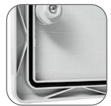
Высокая пыле- и влагозащищенность IP65. Ребра жестко- сти по бокам дверей