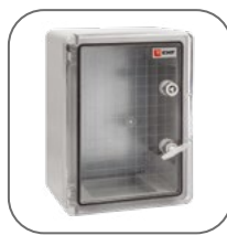
Исполнение с про- зрачной дверью