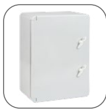
Широкий диапазон рабочих температур: -45... +80 °С