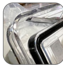
Толщина корпуса 4 мм